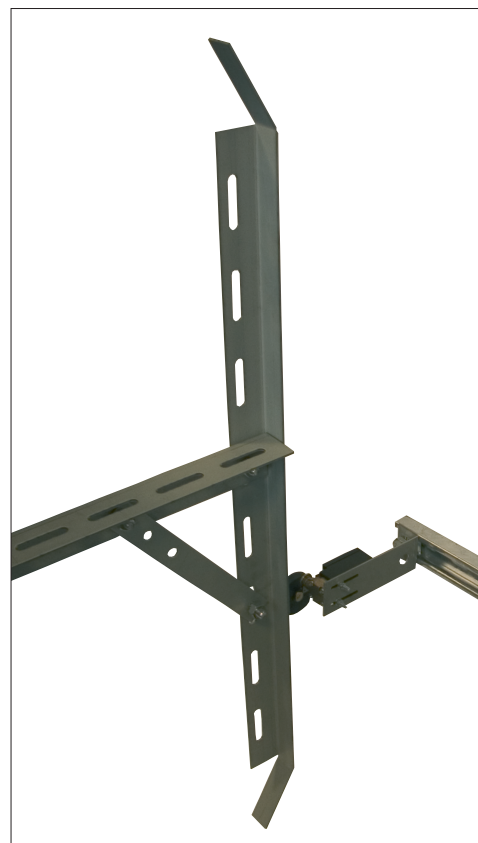
Schaltkurve 750 oder 2000mm lang